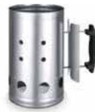
fig. 01 Ciminiera Accenditore Barbecue codice prodotto 02185

Si consiglia l'utilizzo di una ciminiera/accenditore per barbecue. (fig. 01)