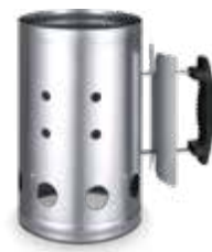
fig.01 Ciminiera Accenditore Barbecue codice prodotto 02185