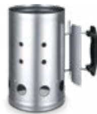
fig.01 Ciminiera Accenditore Barbecue codice prodotto 02185