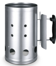
fig.01 Ciminiera Accenditore Barbecue codice prodotto 02185